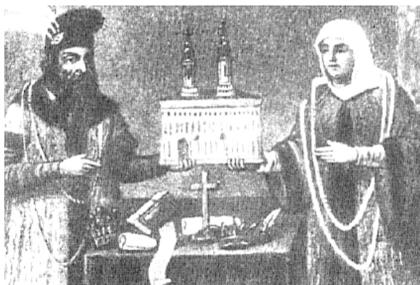
Domnitorul Petru Șchiopu cu soția sa Irina

Cronica orașului Hall din Tirol scrie: „1592 den 5. July, so der Sonntag nach Trinitatis war, kam und fuhr ein Fürst mit Namen Petrus aus der Moldau, so aus Siebenbürgen und aus der Walache stammt, mit etlich vielem Gutsvermögen, mit anderer vieler Nationen Manns und Frauens Personen.... haben auch in der Zeit, da sie hier gewesen,