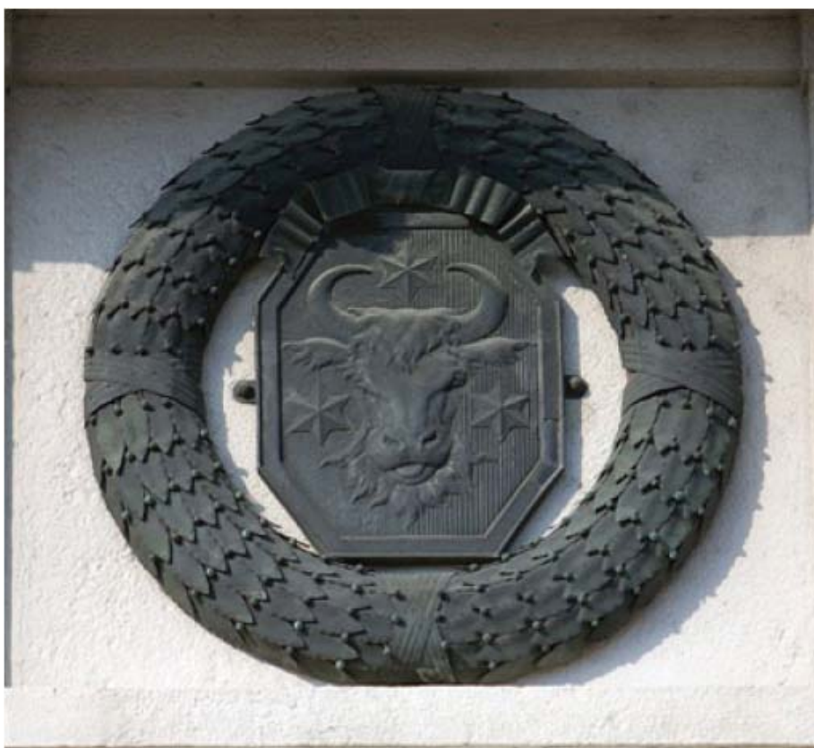
Stema Bucovinei așezată pe portalul palatului imperial din centrul Vienei

Viața religioasă a românilor ortodocși care au trăit ori trăiesc în Austria este o parte constitutivă a unei conviețuiri istorice de aproape trei veacuri. Această istorie este strâns legată de istoria Monarhiei și a austriecilor, alături, și față în față cu românii, care au trăit ori trăiesc aici, sau cu cei care au trăit în provinciile românești, ce au aparținut Imperiului habsburgic: Transilvania (1688-1867-1918), Oltenia (1718-1739), Banat (1718-1918) și Bucovina (1775-1918) 66 .