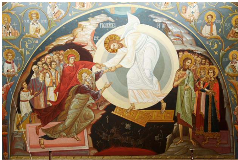
Pogorârea la iad- pictură din Biserica Ortodoxă Româna din Viena.

Învierea Domnului pe care o prăznuim astăzi cu atâta entuziasm și bucurie este Sărbătoarea prin excelență a vieții care se reînnoiește în noi prin moartea și învierea Mântuitorului Iisus Hristos. Dumnezeu l-a creat pe om pentru ca el să participe la comuniunea de viață și de iubire a Sfintei Treimi: a Tatălui și a Fiului și a Sfântului Duh. Atâta timp cât primii oameni au rămas în ascultare de Dumnezeu, deci în comuniune cu El,