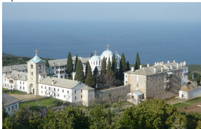
Schitul românesc Prodromu - Mt. Athos

Ce rămâne, până la urmă, și dincolo? Rămâne dragostea, care pe toate le desăvârșește. "Cum îl iubește Dumnezeu pe om? Dar ce să spun eu? Avem cuvântul Evanghelistului: Așa a iubit Dumnezeu lumea, încât pe Fiul Său Cel Unul-Născut L-a dat ca oricine crede în El să nu piară, ci să aibă viața veșnică. Ce e mai mult decât asta? Ne-a dat învățătura dumnezeiască, ne-a lăsat rânduiala minunată a înduhovnicirii omului, ne-a pregătit viața veșnică și ne așteaptă: Veniți să moșteniți împărăția gătită vouă! Sfântul Cuvios Moise spunea: Puțină este osteneala, veșnică odihna."