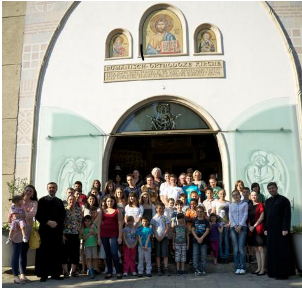
Elevi după rugăciunea de mulțumire la sfârșitul anului școlar, 23.06.2012