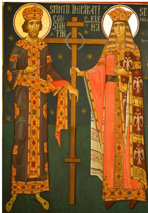
Fresca din biserica din Viena, pictor Vasile LEFTER

Libertatea ca dar divin ni se încredințează și se păstrează în viața noastră prin lucrarea și ajutorul Duhului Sfânt. Sf. Ap. Pavel ne descoperă că „ unde