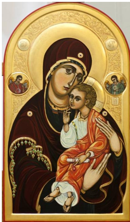
Icoană din Iconostasul Bisericii Ortodoxe din Viena

Dar prezența pietrelor nu rămâne doar la atât. Citind Apocalipsa Sf. Ioan Teologul, la cap. 21 am aflat ca „Cetatea Sfântă” din cer pe care Sf. Ioan o descrie în viziunea sa, are un număr clar definit de pietre în zidurile ei. Ba mai mult, există 12 pietre de temelie, pietre ce îi reprezintă pe cei 12 apostoli. Cu greu am reușit să adunăm aceste pietre, sprijiniți de un cunoscut negustor de pietre din Viena. Ultima piatră am aflat-o la un târg de pietre din Hong Kong. Desigur, totul poate fi interpretat simbolic, dar și așa rămâne potrivit să le avem pe iconostas. Cele 12 pietre au fost fixate la baza fiecărei icoane ce îi reprezintă pe cei 12 apostoli.